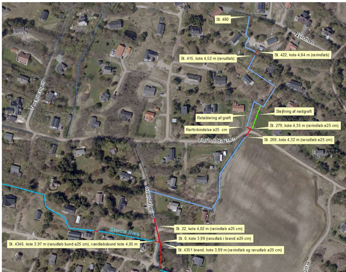
Stationeringer, koter og dimensioner.