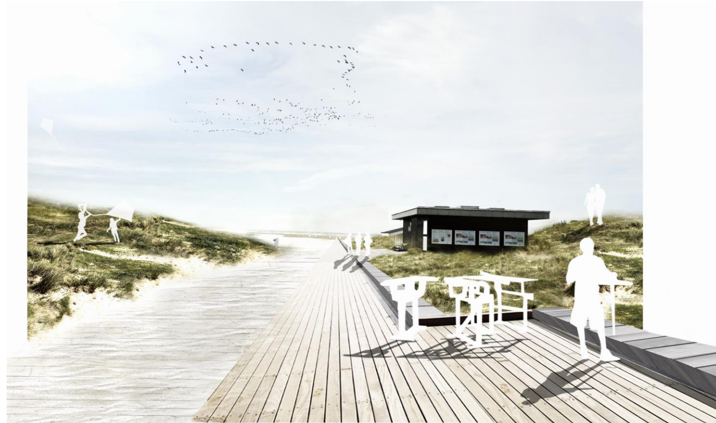
Illustration fra tidligere skitseprojekt